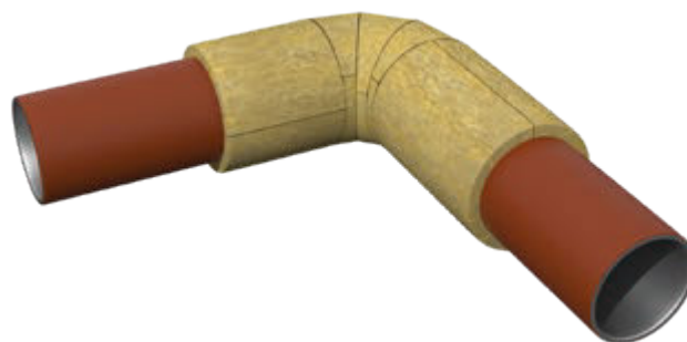
Схема изоляции отводов и тройников малых диаметров

Изоляция крутоизогнутых отводов больших диаметров